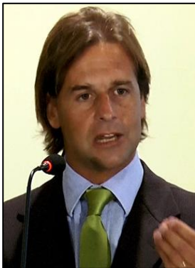
Luis Alberto Lacalle Pou (URU)

Senior Researcher at the Institute for Advanced Studies on development (INESAD) Investigador Senior en el Instituto de Estudios Avanzados en Desarrollo (INESAD)