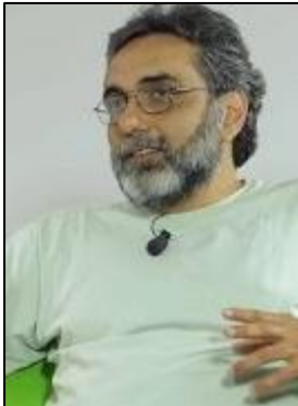
Gustavo Codas (PAR)

Uruguayan Politician and Presidential candidate by the National Party in the elections 2014 Político Uruguayo y candidato a Presidente por el Partido Nacional en las elecciones 2014